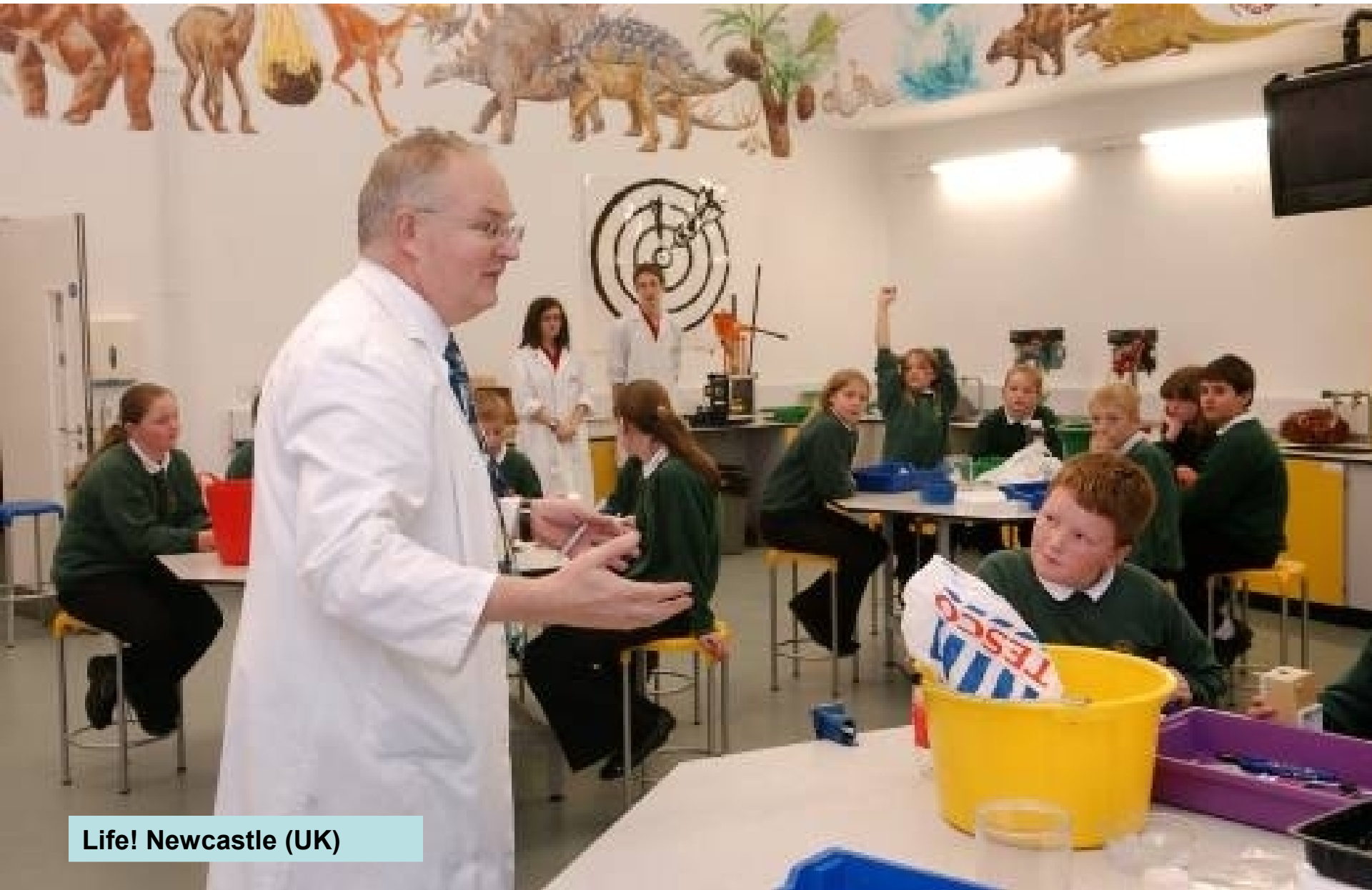
Life! Newcastle (UK)