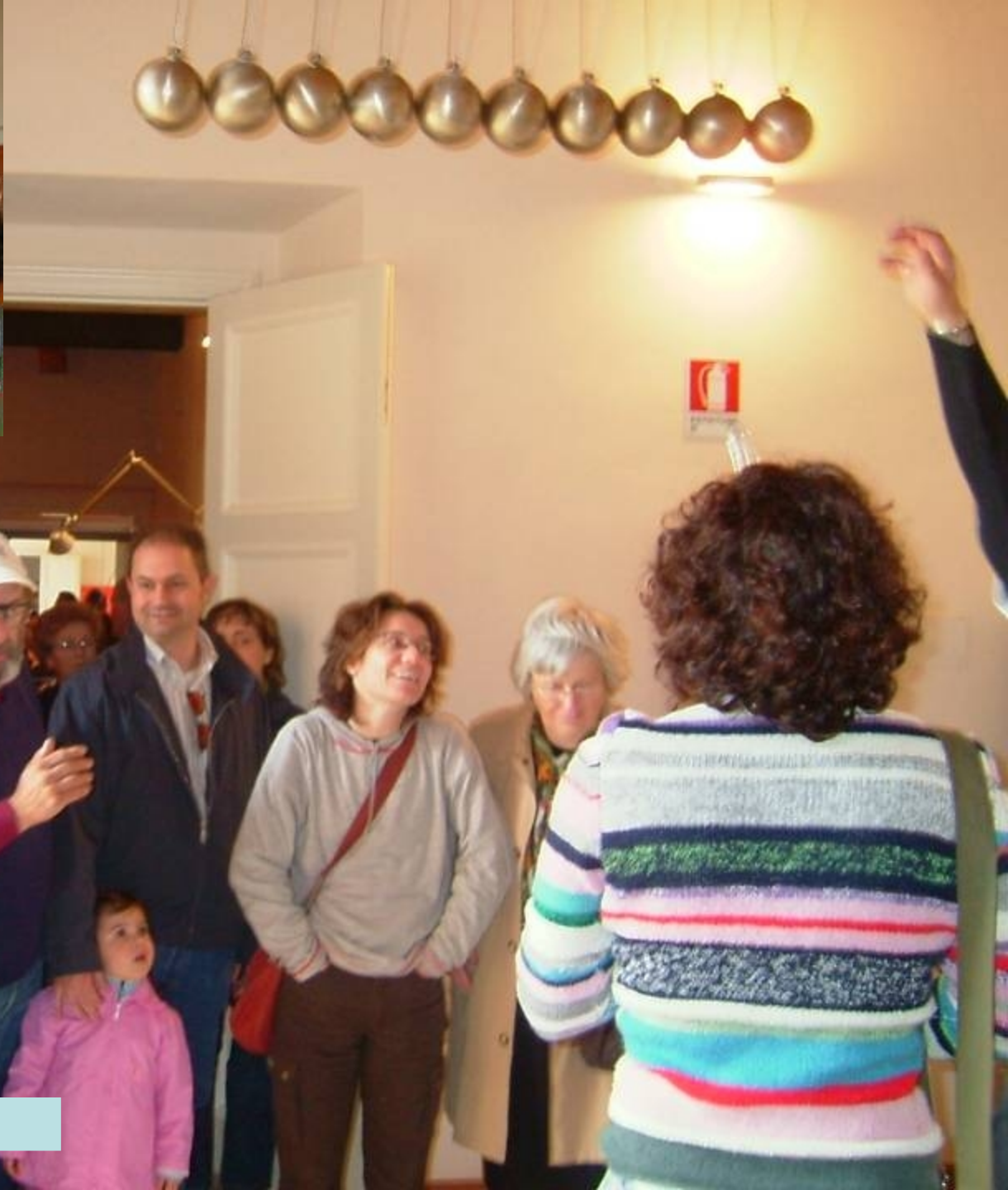
Museo del Balì, Saltara (Urbino)