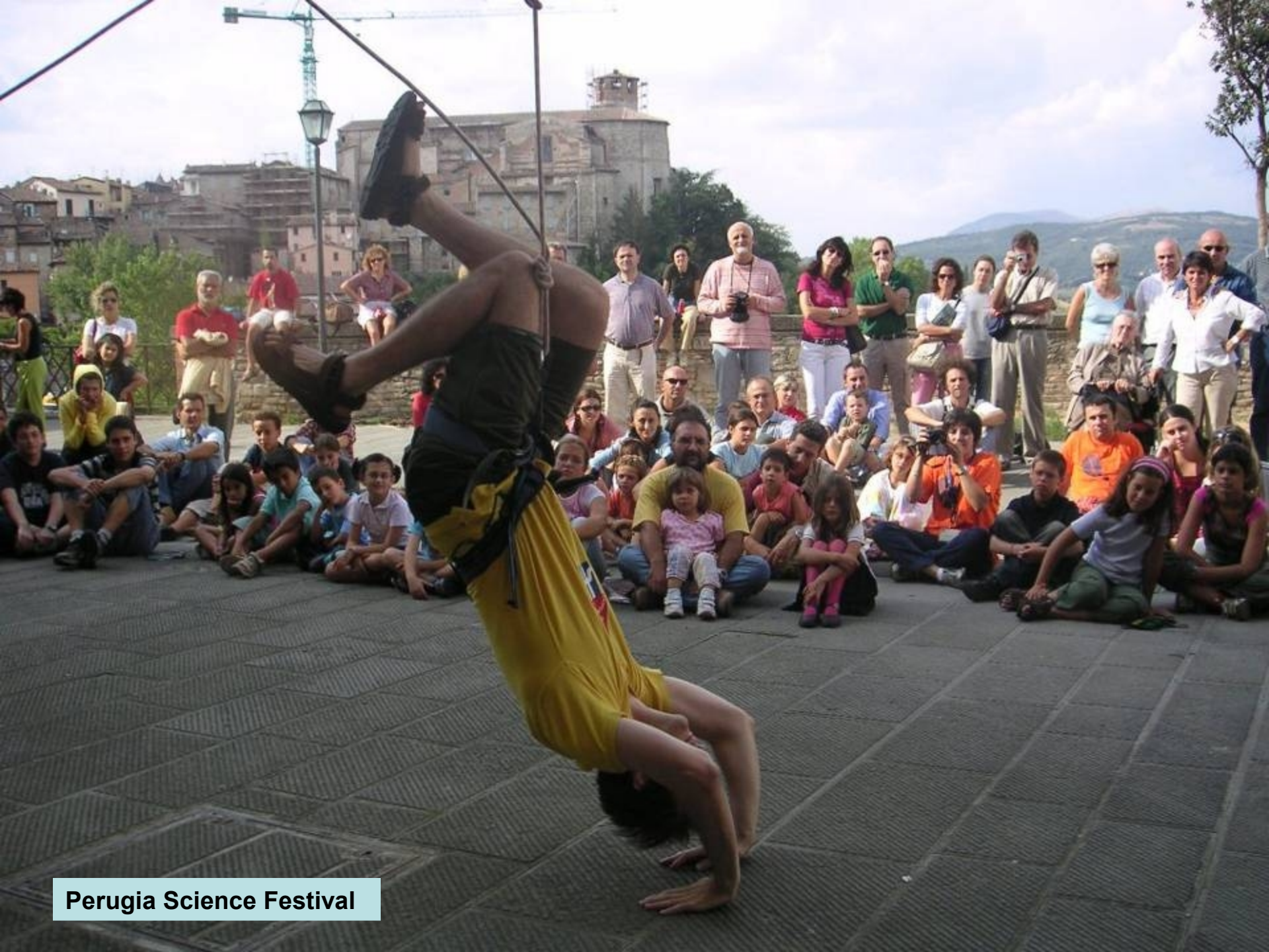
Perugia Science Festival