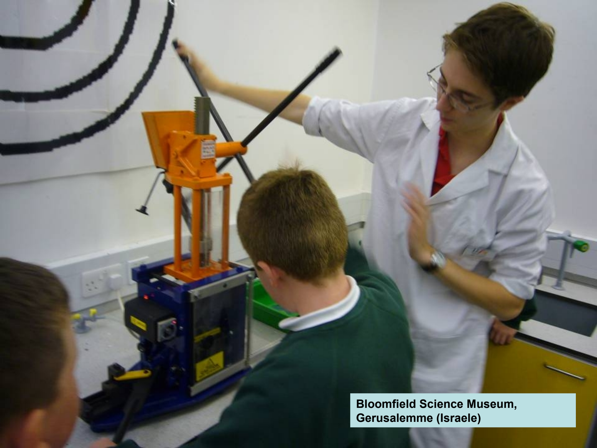
Bloomfield Science Museum, Gerusalemme (Israele)