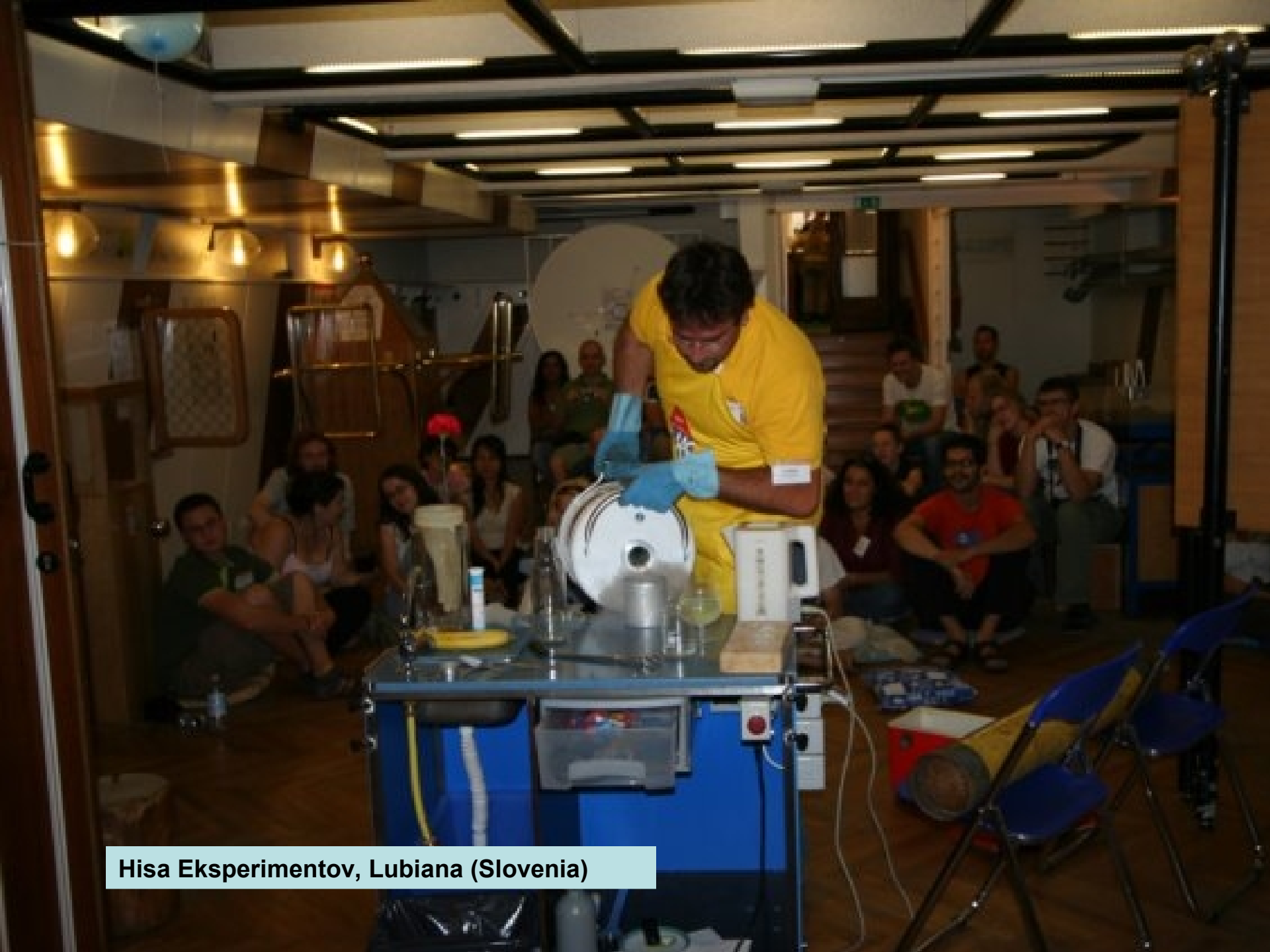
Hisa Eksperimentov, Lubiana (Slovenia)