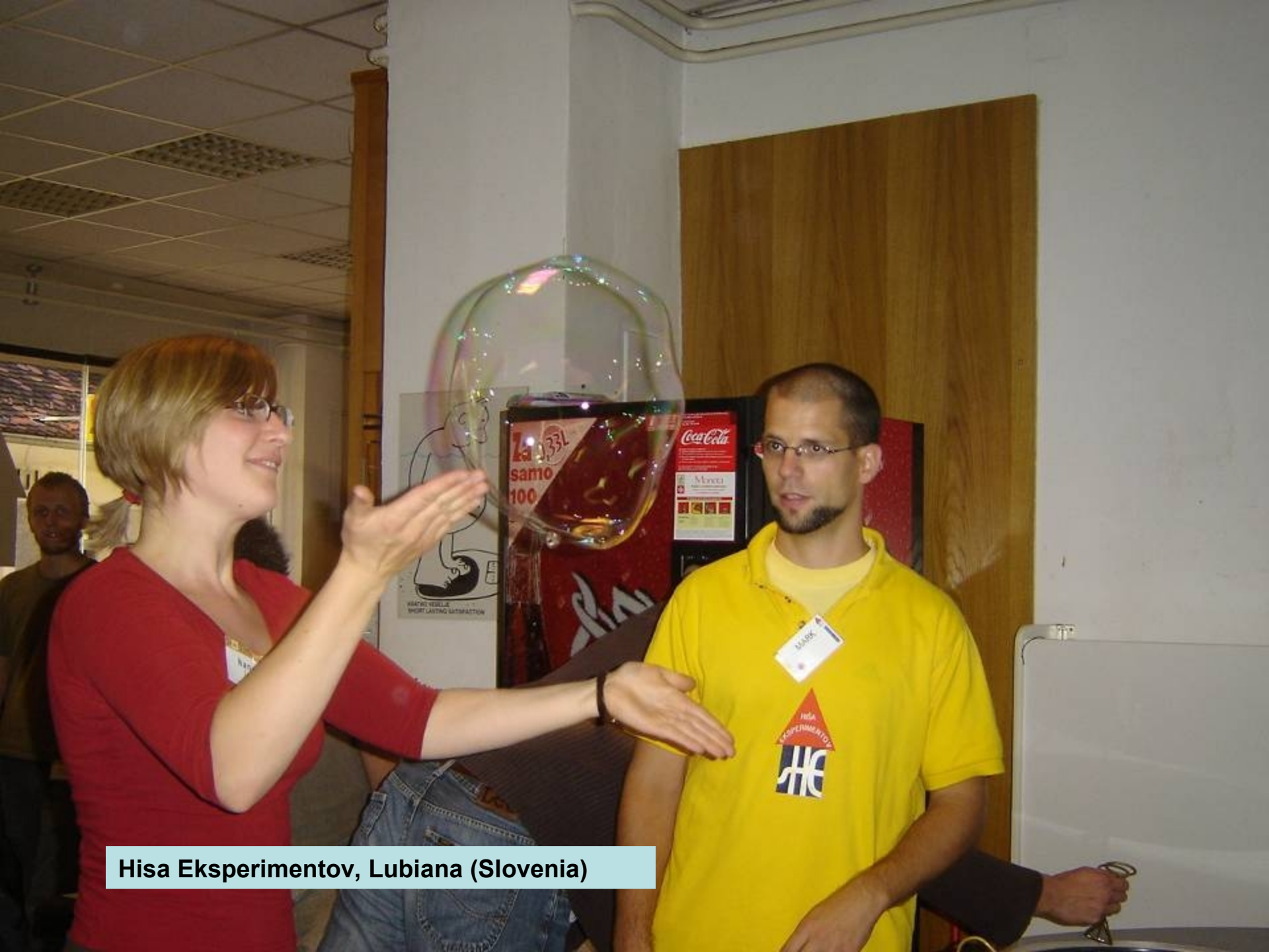
Hisa Eksperimentov, Lubiana (Slovenia)