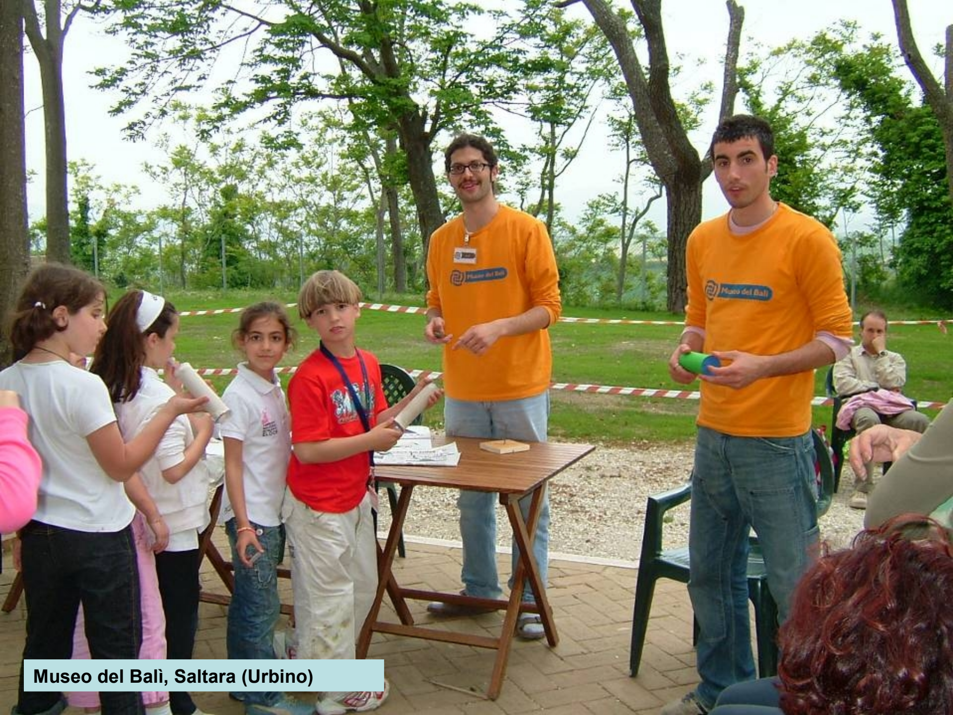
Museo del Bali, Saltara (Urbino)